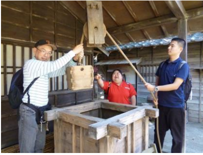
いと たいけん 井戸のセットも体験