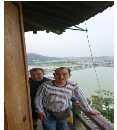
いぬやまじょう てんしゆかく ☆犬山城の天守閣☆ きゆう かいだんのほ 急な階段を上りました！！