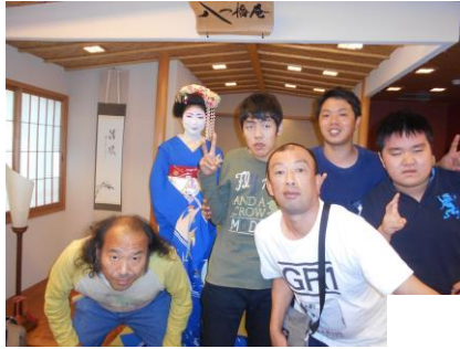
まいこ 舞妓さんとポーズ