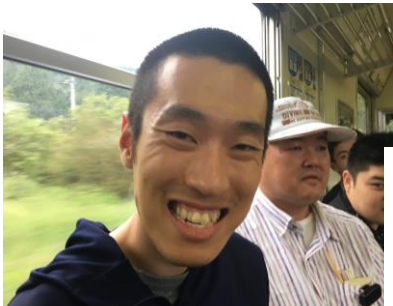
れっしや かぜ きもち 列車の風は気持ちいい