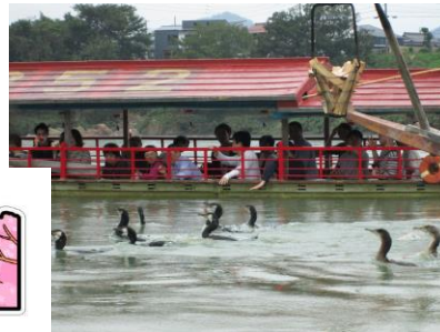
ほんてん ふね まえ 本店の舟の前には、鵜が！！