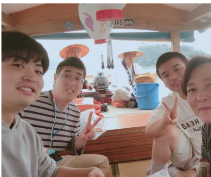
ほんてん ふね なか せんどう ぜんぼう 本店、舟の中。船頭さんが前方に！